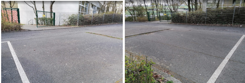
... Mögliche Stellplätze

Vor dem Eingang der Grundschule und deren Turnhalle befinden sich nicht genutzte asphaltierte Flächen. Zugleich fehlen an diesen hochfrequentierten Orten Möglichkeiten, ein Fahrrad (oder einen von Grundschulern oft genutzten Tretroller) sicher abzustellen. Ein sicherer Abstellplatz kann dazu beitragen, dass Wege zur Schule oder zum (Vereins-)Sport in der Schulturnhalle öfter mit dem Rad (oder dem Tretroller) zurückgelegt werden.