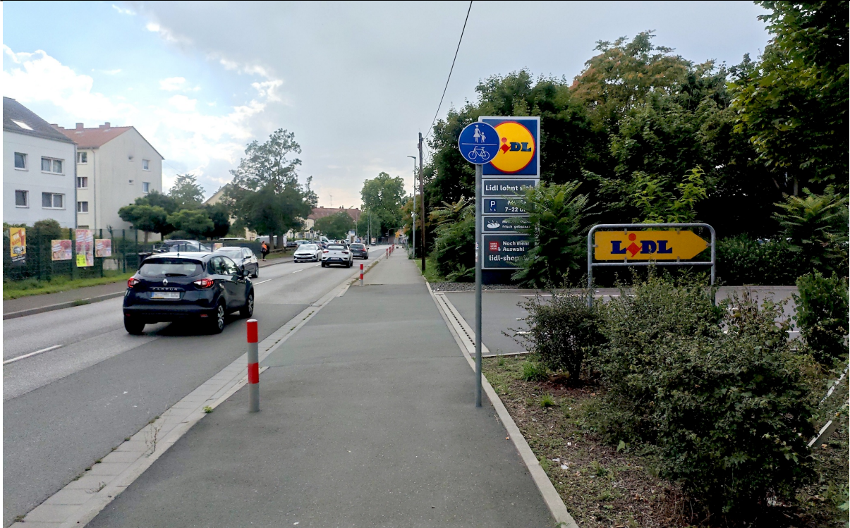
Abbildung 3: Zufahrt zum Parkplatz des Supermarkts in der Hochheimer Str. 103. Diese Einfahrt wird viel genutzt. Um Unfälle zu vermeiden, soll mindestens an dieser Stelle eine Markierung auf den Fuß- und Radweg aufgebracht werden, die Verkehrsteilnehmer auf den Radverkehr hinweist.