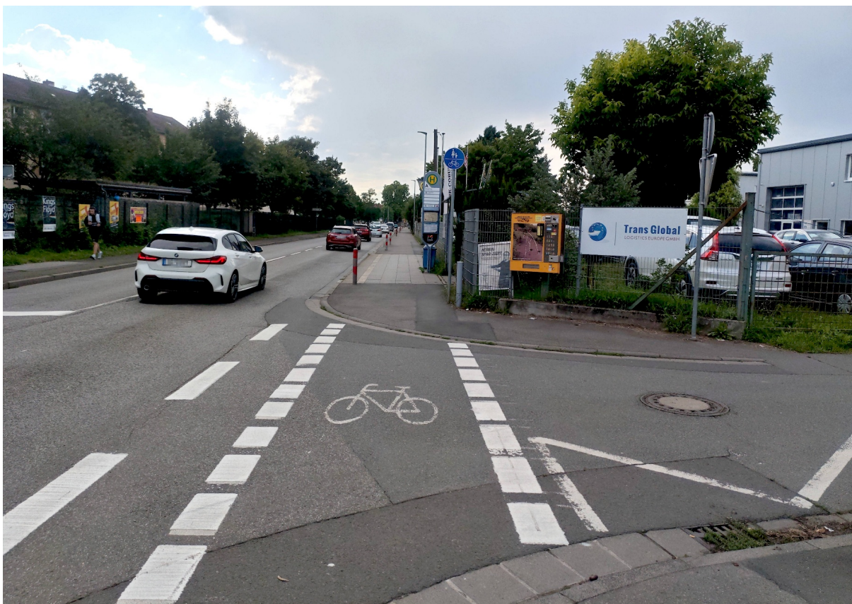
Abbildung 2: Radweg in der Hochheimer Straße, Ecke Mittlerer Sampelweg (rechts). In diesem Abschnitt der Hochheimer Straße ist das Trottoir auf der Seite der ungeraden Hausnummern ein gemeinsamer Fuß- und Radweg (VZ 240). Hier ist bereits eine Markierung vorhanden, die auf den Radverkehr hinweist.