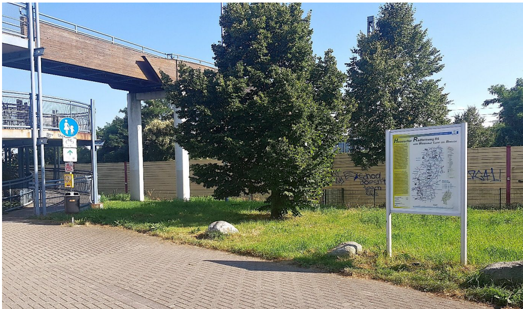
Abbildung 1: Grünfläche auf der nördlichen Seite der „Schneckenbrücke“ am Abzweig zum Steinern-Kreuz-Weg. Hier kann eine Sitzgelegenheit aufgestellt werden.

Der Weg aus dem alten Ortskern zum Kostheimer Friedhof ist eine viel genutzte Strecke für Fußgänger, die besonders von älteren Bürgerinnen, die zur Grabpflege zum Kostheimer Friedhof müssen, genutzt wird. Die Strecke beträgt etwa 1,5 Kilometer, zu Fuß benötigt man - laut verschiedener Routenplaner - rund 20 Minuten für diesen Weg. Gerade für ältere Menschen ist dieser lange Weg beschwerlich. Das gilt besonders bei Hitze im Sommer, da Gräber beinahe täglich gegossen werden müssen. Es gibt auf der Strecke kaum Möglichkeiten, sich hinzusetzen und auszuruhen. Eine Sitzbank auf der Höhe der Schneckenbrücke wäre daher wünschenswert.