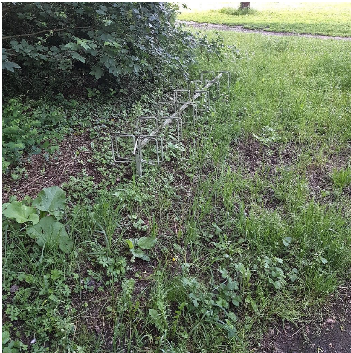
Abbildung 1: Fahrradständer am südöstlichen Rand der Grill- und Liegewiese, zwischen Fuß- und Radweg sowie Freibad Maarau, auf Höhe des Restaurants „Rheinschanze“. Diese Anlage soll durch eine moderne ersetzt werden.