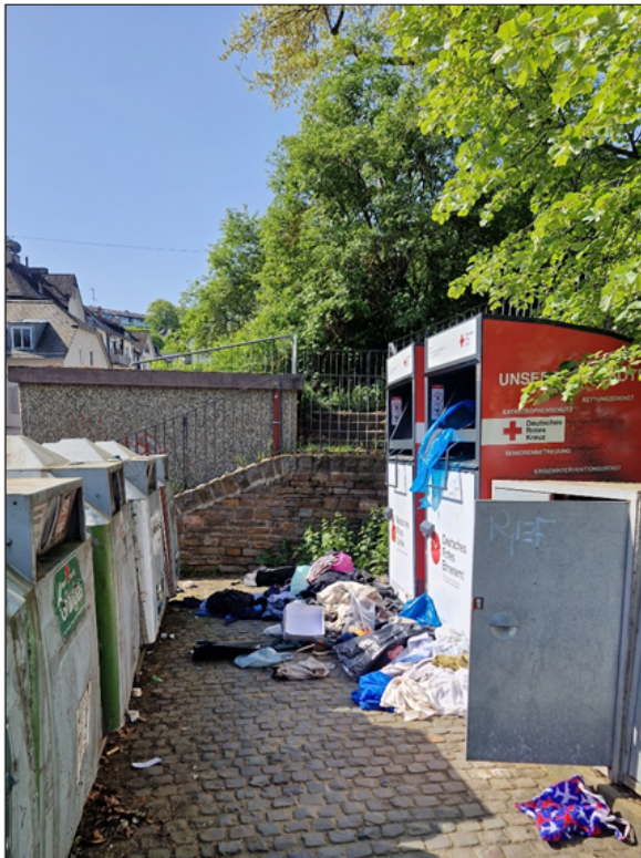
Zustand am 30.04.2024

Dass der Magistrat dafür auch kurzfristig Mittel zur Verfügung stellen kann, zeigt der kurzfristige Bau einer reinen Toilettenanlage in Breckenheim.