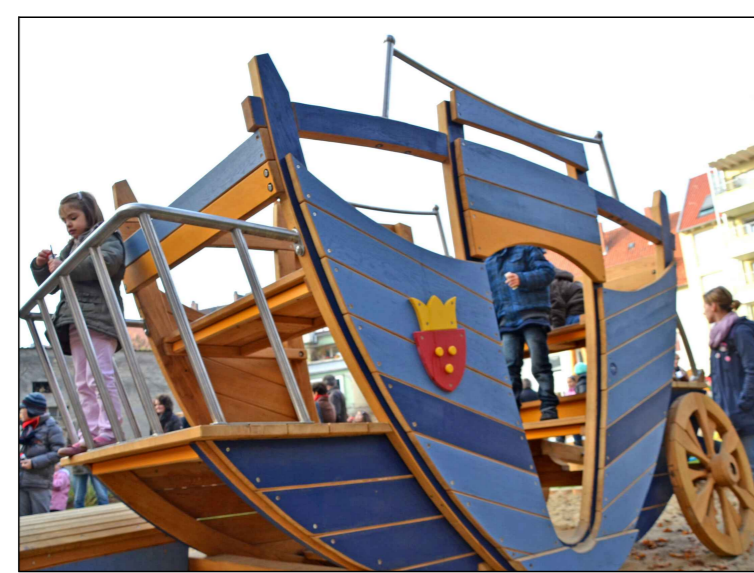
Beispiel für Droschke