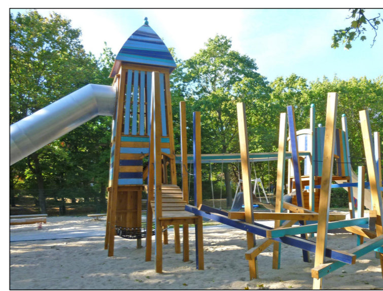
Beispiel für Mehrfach-Schaukel