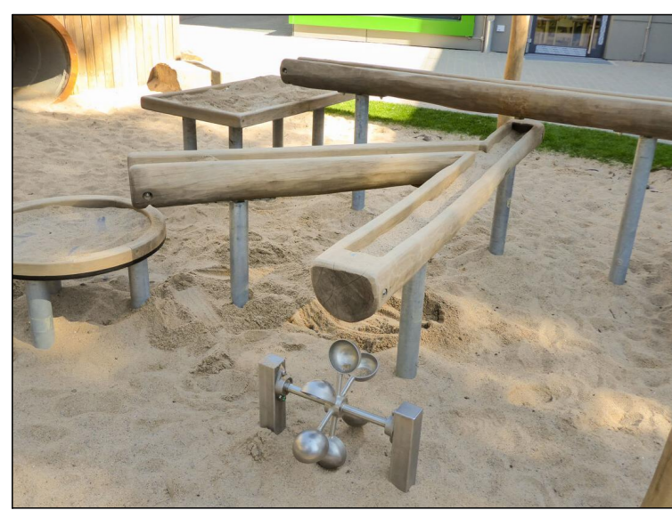
Beispiel für Wasser-Rinnen-Spielanlage