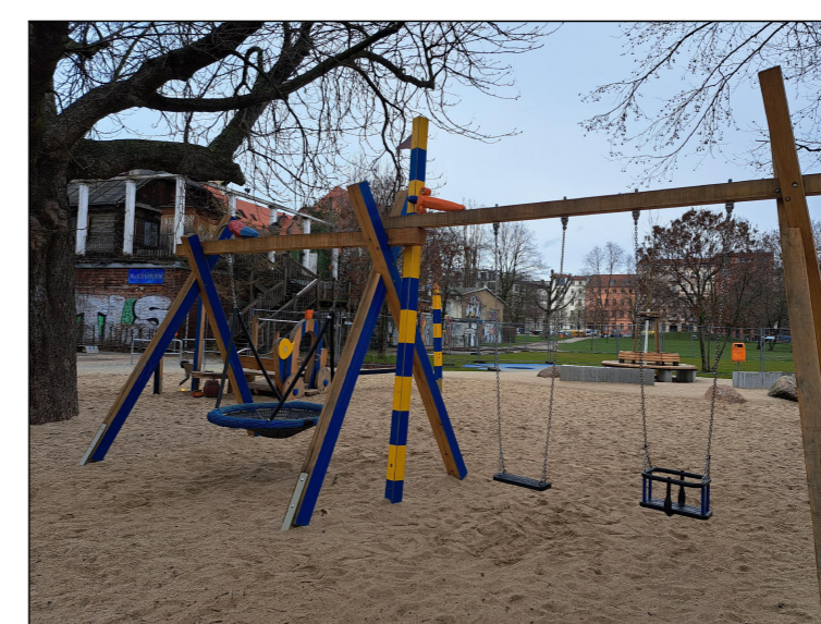
Beispiel für Mehrfach-Schaukel