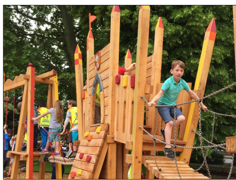
Beispiele für große Kletterspielanlage