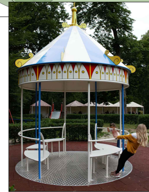
Beispiel für Karussell