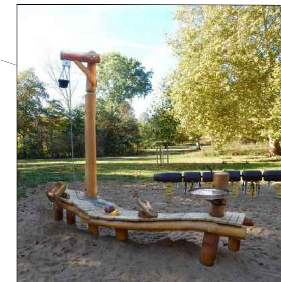
Beispiel für Sandspielküche