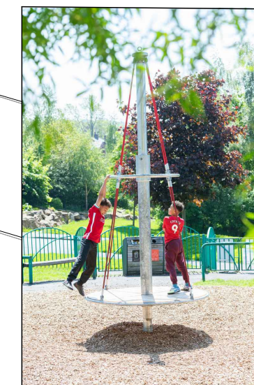
Beispiel für Drehspiel 'Wirbelwind'