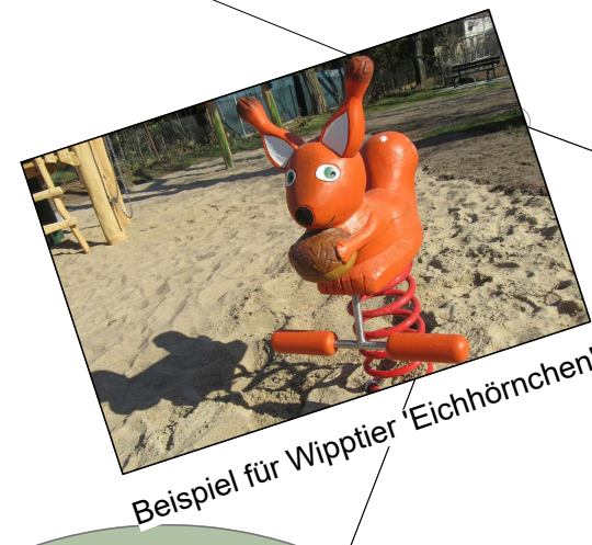
Beispiel für Wippter 'Eichhörnchen'