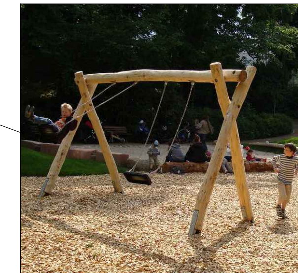
Beispiel für Doppelschaukel