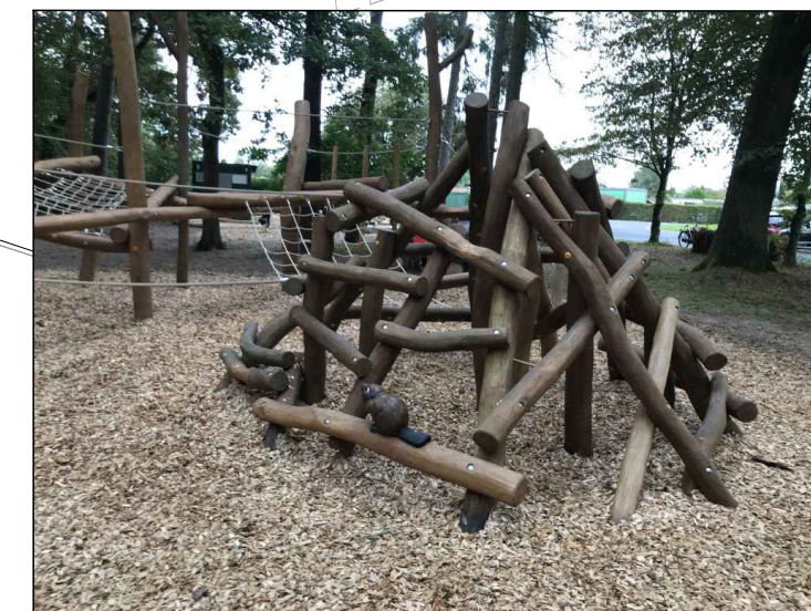
Beispiele für Kletterspielanlagen 'Eichhörnchenkobel'