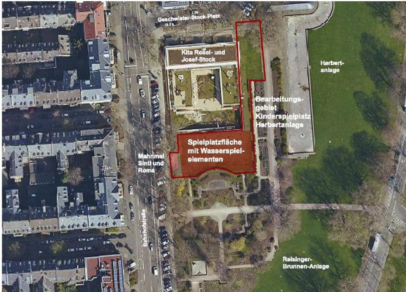
Grafik: Grünflächenamt Wiesbaden