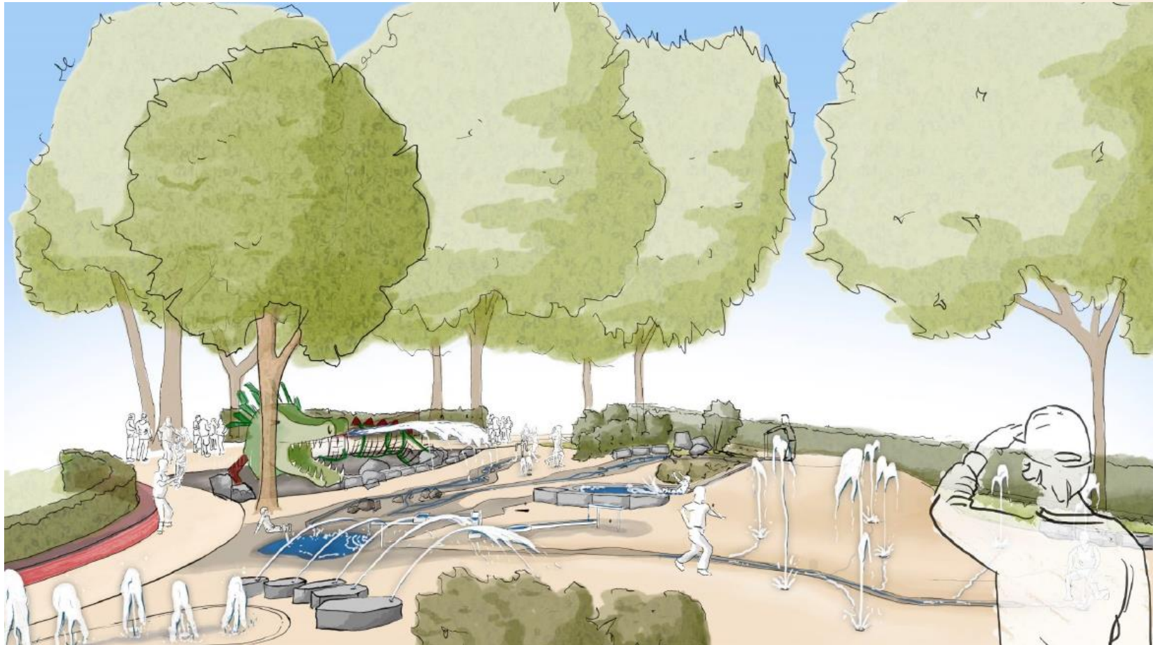
Visualisierung: B.S.L. Landschaftsarchitektur