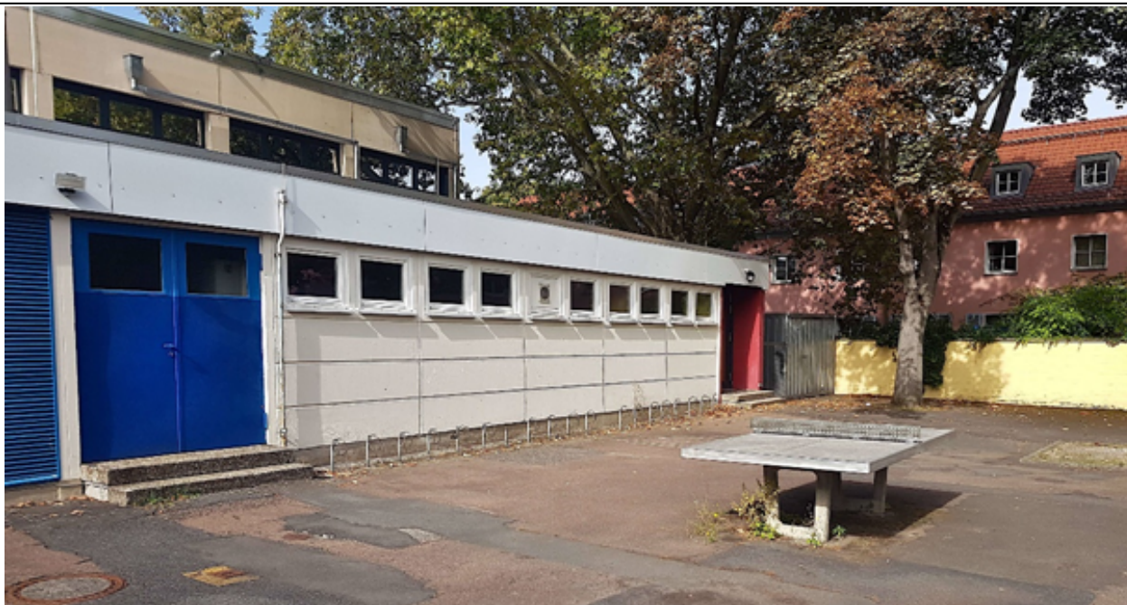
Abbildung 1: Veraltete Vorderradklammen auf der Rückseite der Turnhalle der Brüder-Grimm-Schule in Mainz-Kostheim.