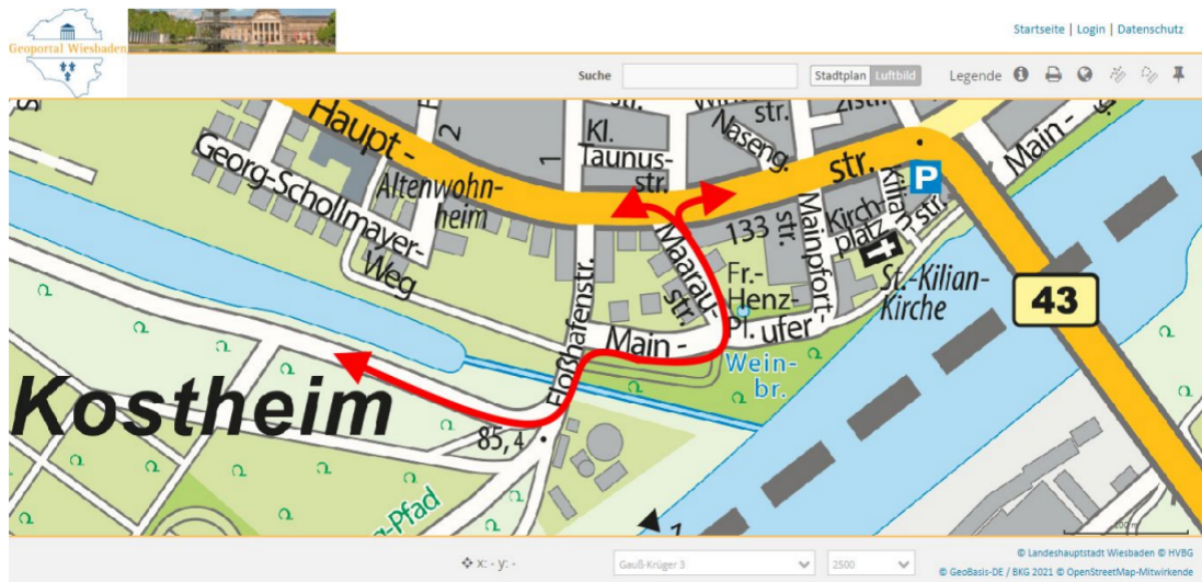
Abbildung 2: Hauptverkehrsrichtung des motorisierten Verkehrs (PKW und Campingwägen).