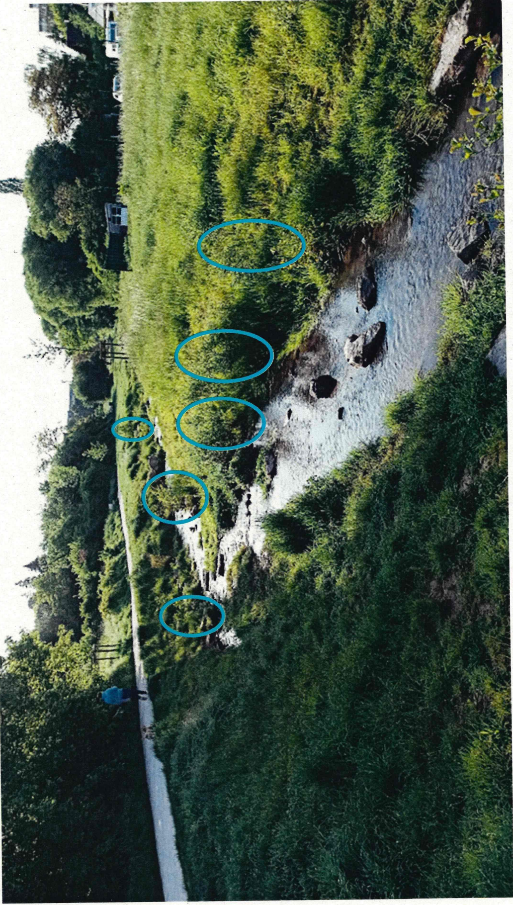
Natürlicher Auswuchs von Erlen entlang des Bachbetts