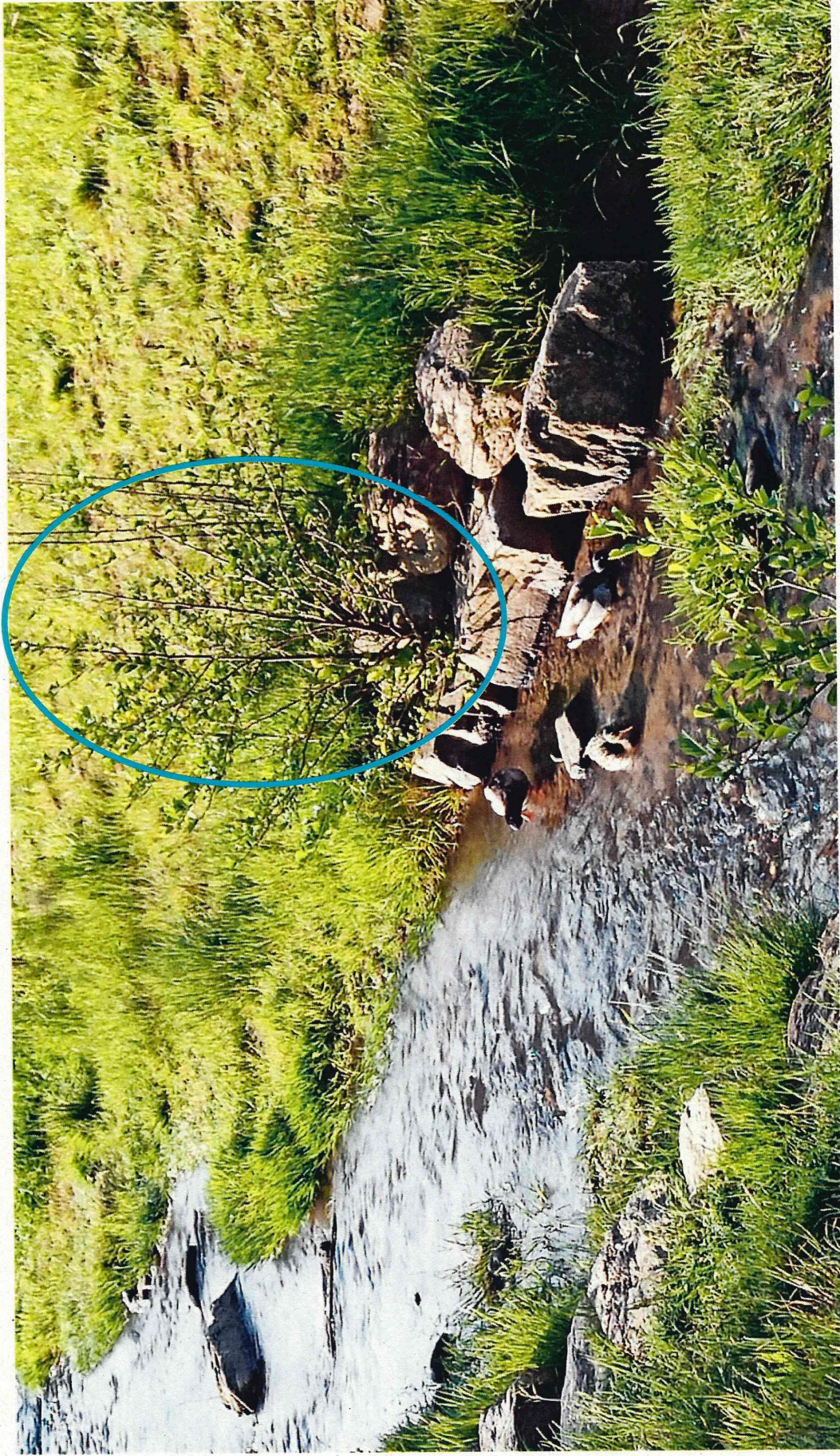
Natürlicher Auswuchs einer Erle zwischen Steinblöcken