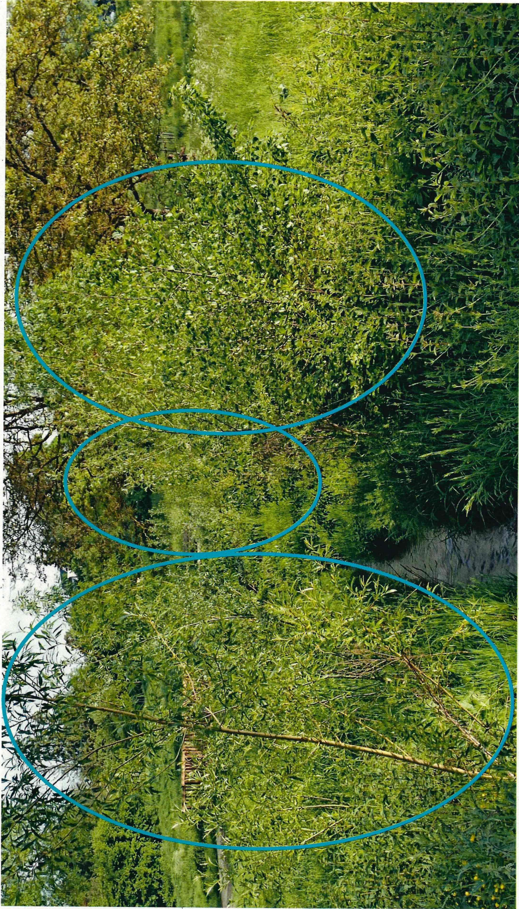
Natürlicher Auswuchs von Weiden zwischen den beiden Absetzbecken