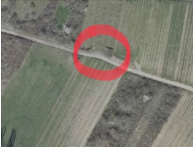
Gem. Frauenstein, Flur 13, Flurstück 401