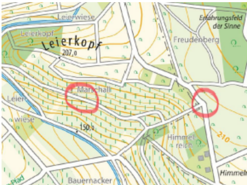
Beide Standorte Karte