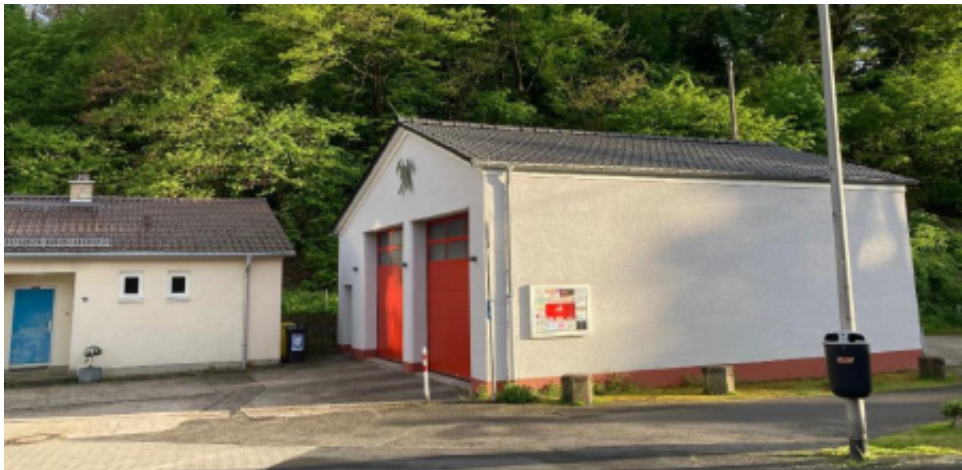
Bild 1: Gerätehaus der Feuerwehr am Standort Rambach, Fahrzeughalle und Unterrichtsraum im angrenzenden Wohngebäude

Die Infrastruktur des Feuerwehrgerätehauses in der Adolf-Schneider-Straße 10 dient der Feuerwehr Rambach dabei als Standort und Grundlage für alle Aktivitäten.