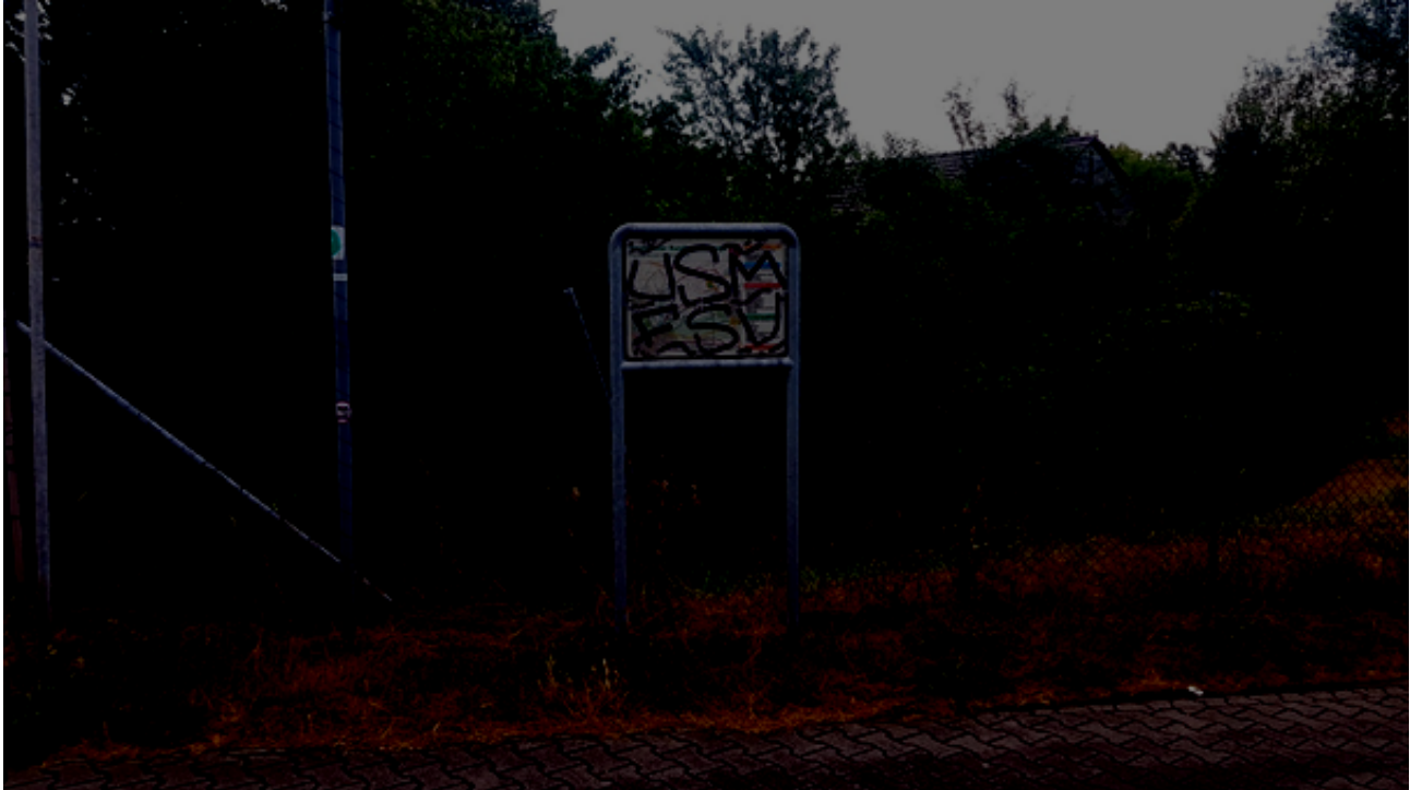
Abbildung 5: Karte mit den Kostheimer Rundwanderwegen an der Hochheimer Straße, Ecke Mühlweg