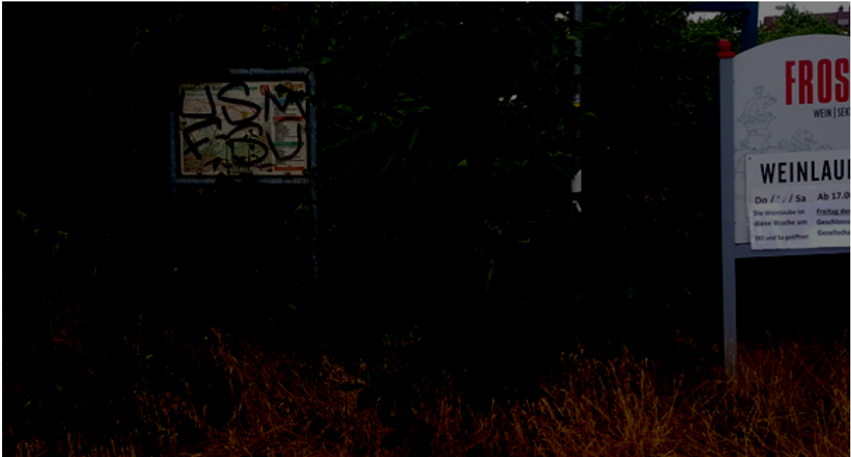
Abbildung 3: Karte mit den Kostheimer Rundwanderwegen an der Hochheimer Straße, Eck Steigweg