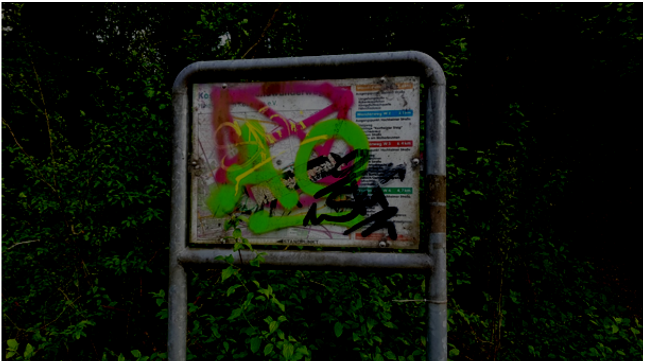
Abbildung 6: Karte mit den Kostheimer Rundwanderwegen im Mühlweg, Ecke Im Langgewann. Dieser Standort liegt vermutlich schon in der Nachbarstadt Hochheim.