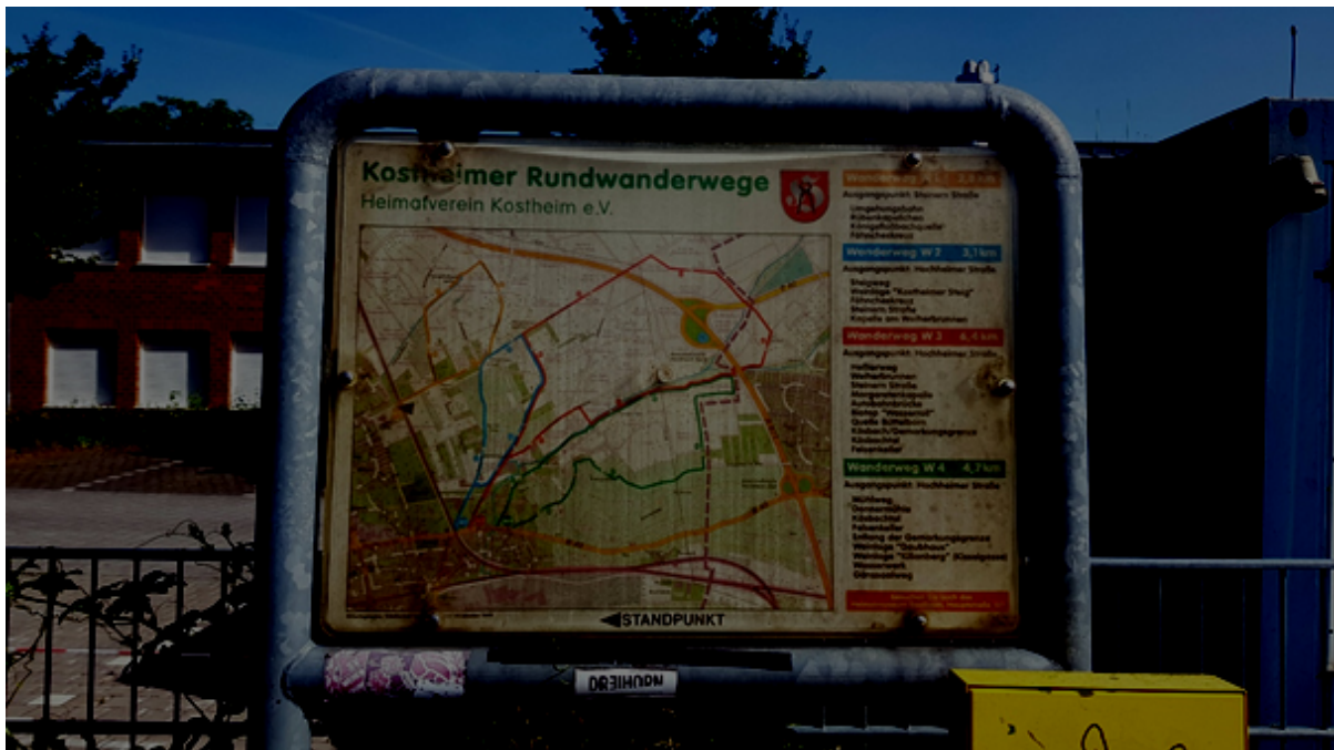
Abbildung 2: Karte mit den Kostheimer Rundwanderwegen an der Krautgartenschule/Steinern Straße

Die vor vielen Jahren in Zusammenarbeit mit dem Heimatverein Kostheim aufgestellten Karten sind entweder beschmiert oder mit der Zeit vergilbt. Sie sind daher nicht mehr gut lesbar und geben kein schönes Bild ab. Die Halterungen und die eigentliche Karte, hinter der Kunststoff-Schutzscheibe, sind in augenscheinlich gutem Zustand. Eine Instandsetzung sollte daher relativ einfach möglich sein.