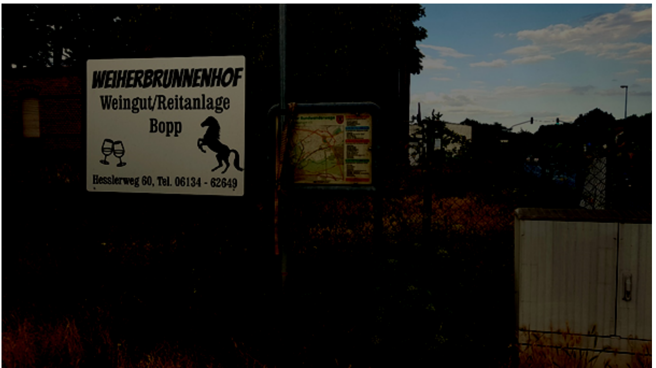
Abbildung 4: Karte mit den Kostheimer Rundwanderwegen an der Hochheimer Straße, Ecke Heßlerweg. An der Karte wurde ein Verkehrsschild mit einem Gurt befestigt.