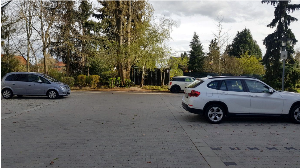
Abbildung 3: Blick vom Parkplatz Im Sempel 4.