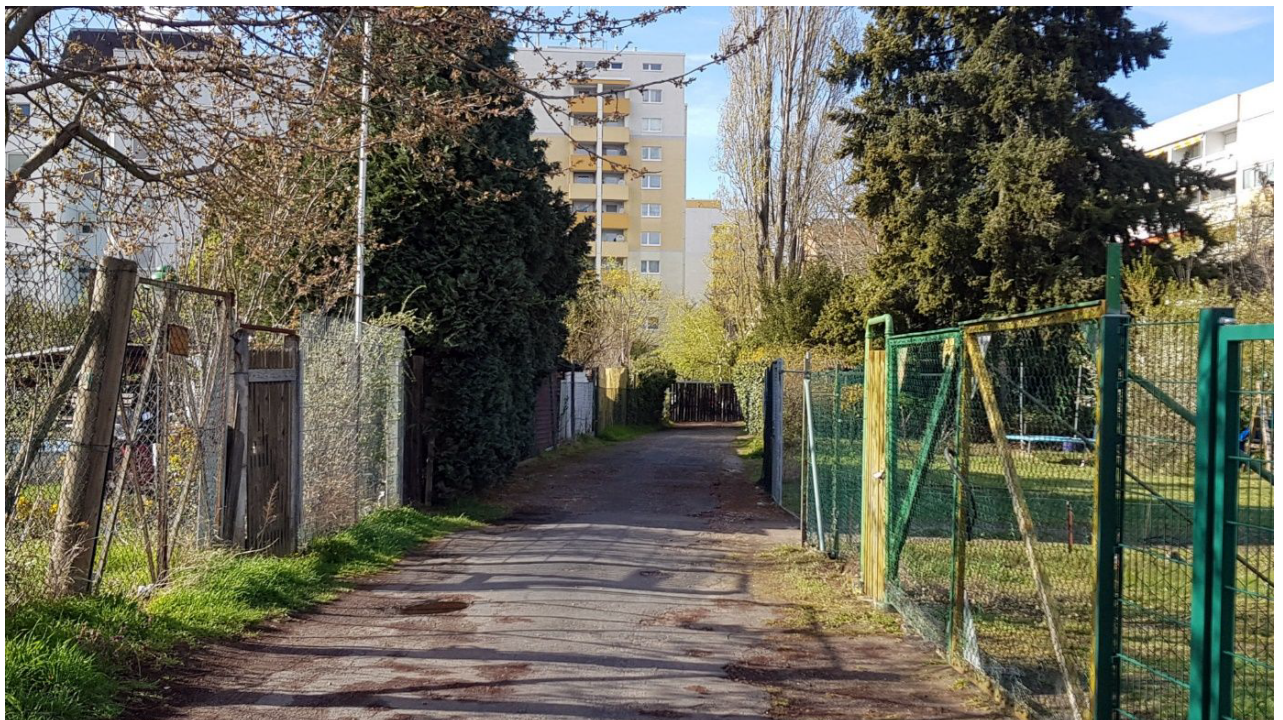
Abbildung 2: Blick vom Unteren Sampelweg in Richtung „Im Sampel“. Der Weg ist am Ende mit einem Bretterzaun versperrt.