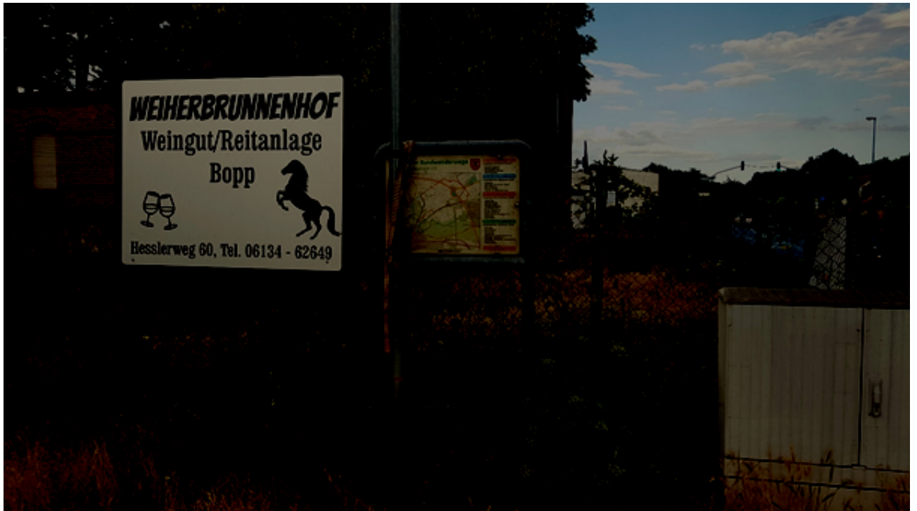
Abbildung 4: Karte mit den Kostheimer Rundwanderwegen an der Hochheimer Straße, Ecke Heßlerweg. An der Karte wurde ein Verkehrsschild mit einem Gurt befestigt.