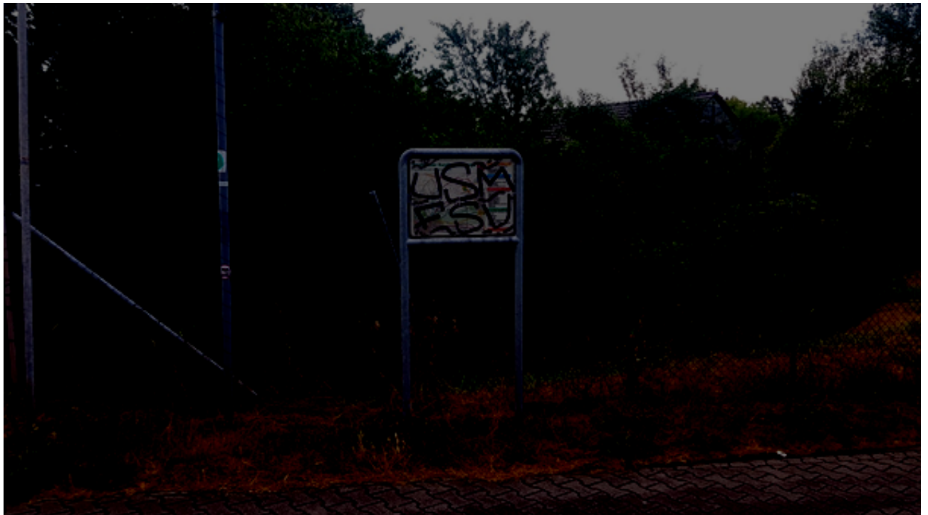
Abbildung 5: Karte mit den Kostheimer Rundwanderwegen an der Hochheimer Straße, Ecke Mühlweg