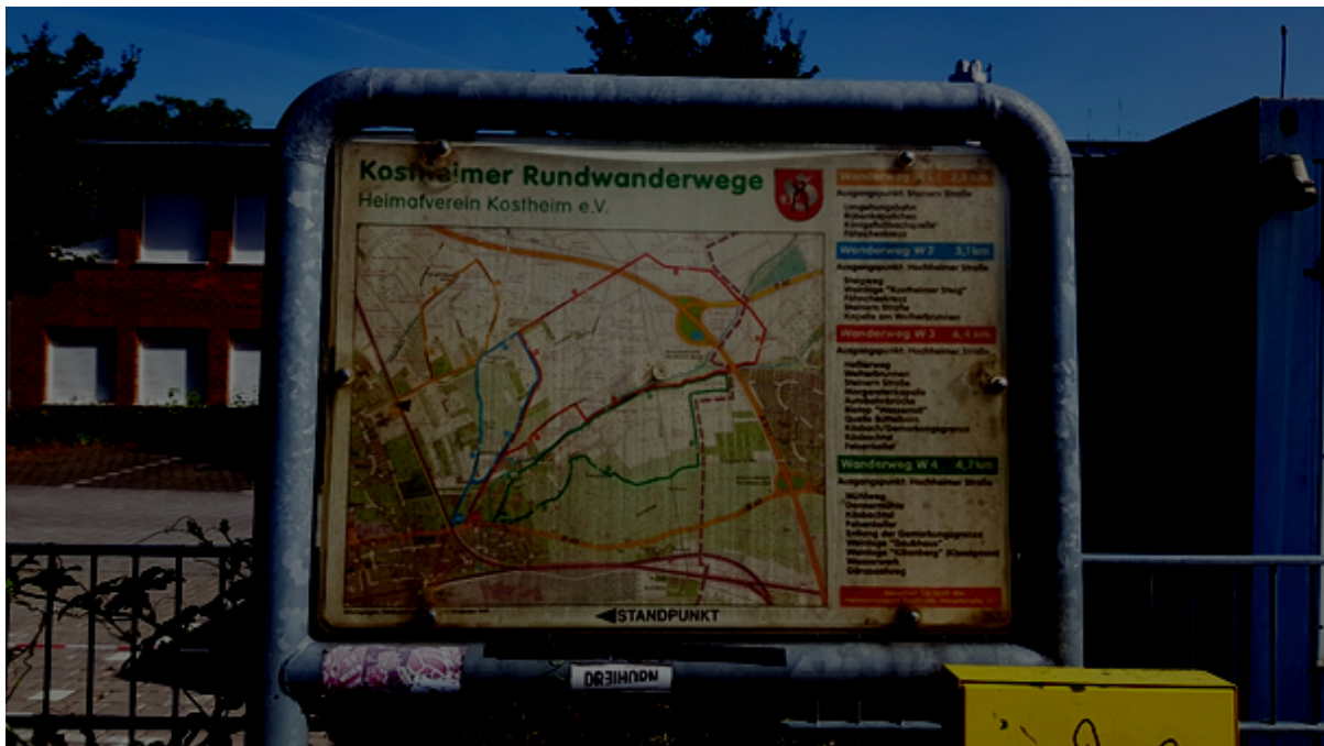
Abbildung 2: Karte mit den Kostheimer Rundwanderwegen an der Krautgartenschule/Steinern Straße

Die vor vielen Jahren in Zusammenarbeit mit dem Heimatverein Kostheim aufgestellten Karten sind entweder beschmiert oder mit der Zeit vergilbt. Sie sind daher nicht mehr gut lesbar und geben kein schönes Bild ab. Die Halterungen und die eigentliche Karte, hinter der Kunststoff-Schutzscheibe, sind in augenscheinlich gutem Zustand. Eine Instandsetzung sollte daher relativ einfach möglich sein.