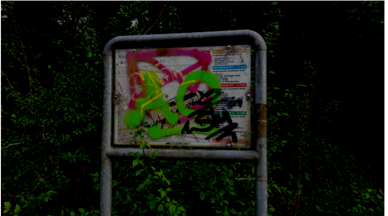
Abbildung 6: Karte mit den Kostheimer Rundwanderwegen im Mühlweg, Ecke Im Langgewann. Dieser Standort liegt vermutlich schon in der Nachbarstadt Hochheim.