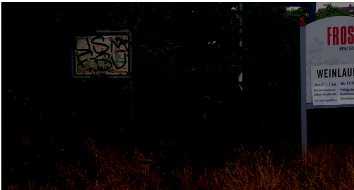
Abbildung 3: Karte mit den Kostheimer Rundwanderwegen an der Hochheimer Straße, Eck Steigweg