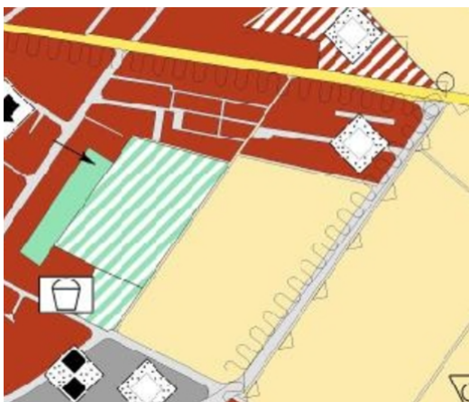
In der Bain

Ausschnitte aus dem genehmigten Landschaftsplan 2002: