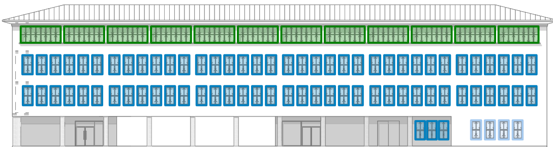
Ansicht Süd, Karlstraße