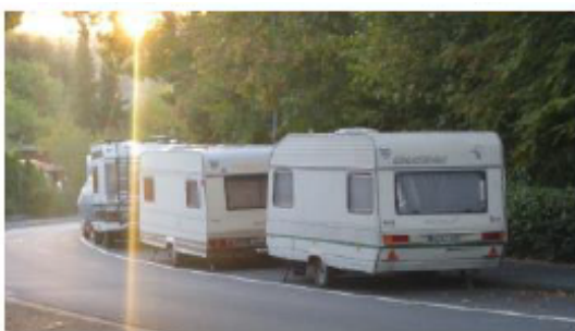
Typische Parkplatzsituation im bezeichneten Bereich