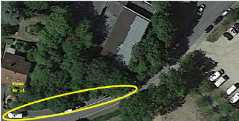
Ansicht in Google Maps des betreffenden Bereichs

vorwiegend Wohnmobile, Anhänger, Sprinter und sogar belegte Bootsanhänger geparkt, vielfach auch als Dauerparkplatz. Durch die Höhe dieser Fahrzeuge ist der Eingang bzw. der Treppenaufgang zur Schule nicht einsehbar. Das bedeutet eine erhebliche Gefahr für die Kinder beim Betreten oder Verlassen der Schule. Auch für vorbeifahrende Autos ist die Lage in dieser Kurve somit unübersichtlich.