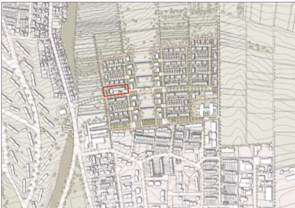
Ausschnitt Rahmenplan Bierstadt-Nord 2013

Weitere Informationen zur Rahmenplanung finden Sie unter: https://www.wiesbaden.de/leben-in-wiesbaden/planen/staedtebauliche-projekte/neue-wohngebiete/bierstadt-nord-startseite.php