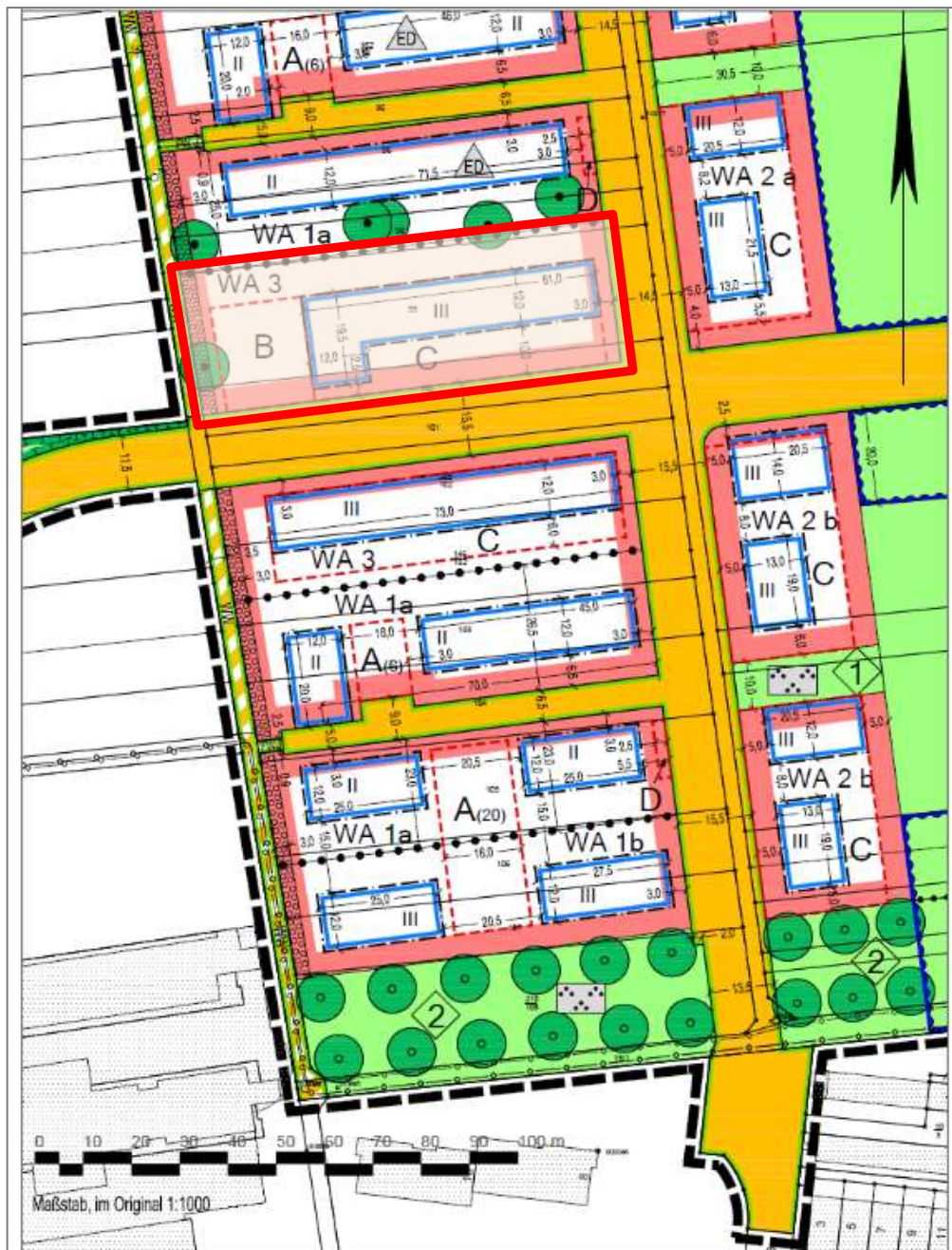
Ausschnitt Bebauungsplan Wohngebiet Bierstadt-Nord - Planzeichnung