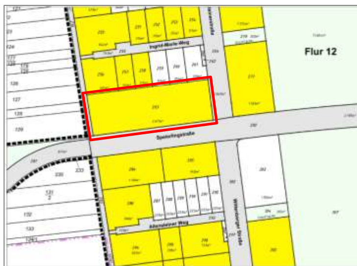
Flur 12 / Flurstück Nr. 263 / Grundstücksgröße ca. 2.611 m 2