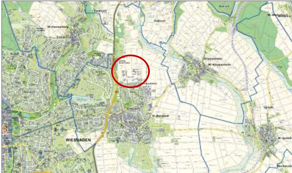
Lage des Wohngebiets Bierstadt-Nord