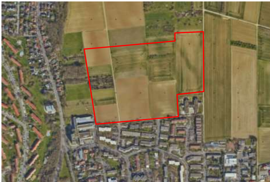
Luftbild Befliegung 2019

Das neue Wohngebiet Bierstadt-Nord befindet sich am nördlichen Siedlungsrand von Bierstadt östlich der B 455. Die Anzahl der geplanten Wohneinheiten in diesem Gebiet beträgt ca. 420. Südlich des Wohngebiets Bierstadt-Nord befindet sich die in den 1960er Jahren entstandene Siedlung „Wolfsfeld“ bestehend aus Geschosswohnungsbauten und verdichteter Reihenhausbebauung. In diesem Wohngebiet sind u.a. die Kita Wolfsfeld, eine Polizeistation und Senioren- und Pflegeeinrichtungen der AWO Wiesbaden vorhanden. Umfangreiche Einkaufsmöglichkeiten befinden sich in der Rostocker Straße (in 500 m Luftlinie zum Wohngebiet Bierstadt-Nord).