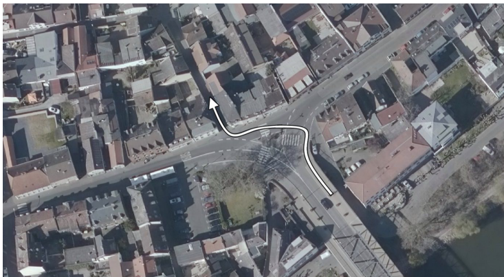
Abbildung 1: Wegstrecke für Radfahrer von der Mainbrücke in die Burgstraße

Der Magistrat der Landeshauptstadt Wiesbaden wird gebeten, eine Wegführung für Radfahrer vom Fuß der Kostheimer Mainbrücke zum Beginn der Burgstraße einzurichten.