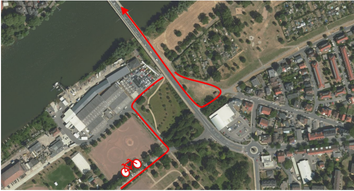
Abbildung 3: Radwegeführung in Gustavsburg um von der Eisenbahnbrücke aus Mainz auf die rechte Fahrbahnseite der Mainbrücke nach Kostheim zu gelangen.