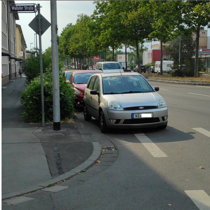
Abbildung 2: Fahrzeug, das zu mehr als der Hälfte auf dem Fahrradweg steht