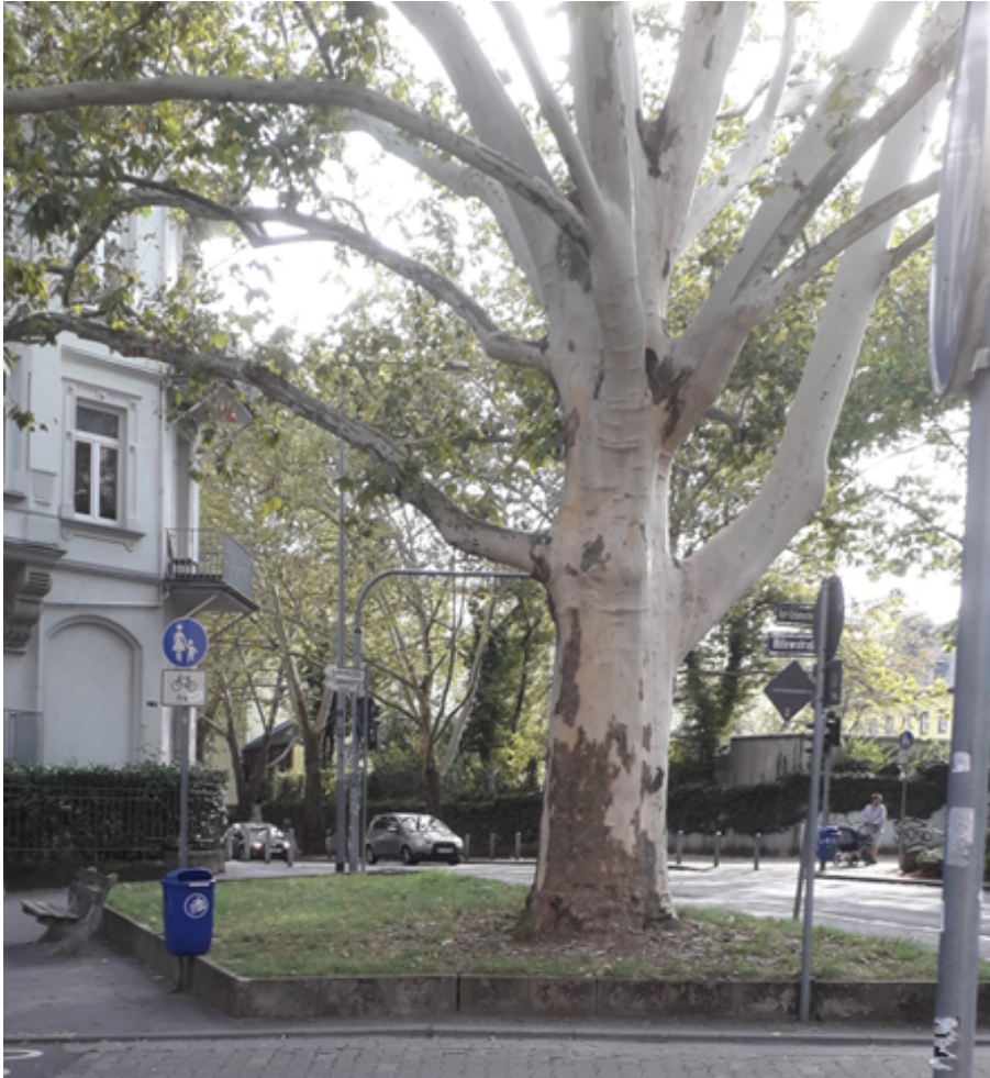
Gegenüberliegende erhöhte Grünfläche