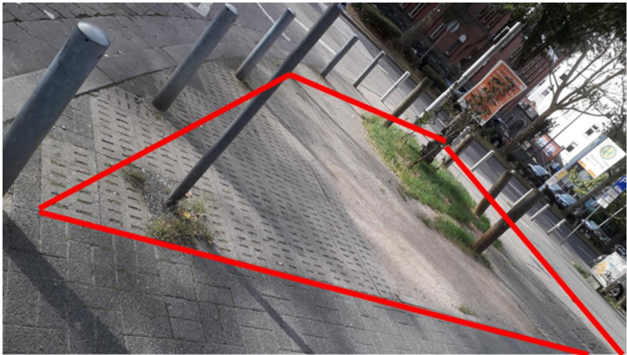
Betroffene Fläche (bereits teilweise entsiegelt und mit anderer Bodenstruktur)