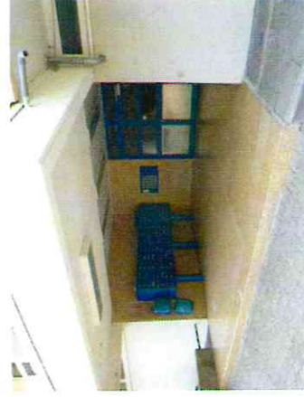
Eingang wirkt dunkel