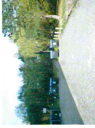
Rampe für Barrierefreiheit