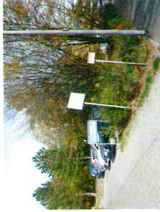
Parkplatz im Eingangsbereich