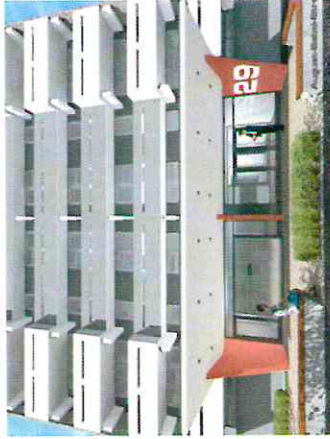
Vorentwurf des neuen Vordachs