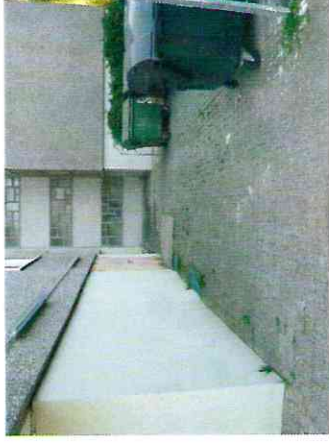
Seiteneingang des Gebäudes