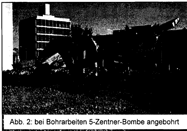
Abb. 2: bei Bohrarbeiten 5-Zentner-Bombe angebohrt

Daher werden Bauvorhaben immer wieder durch Kampfmittelfunde, ja sogar auch „Explosionen von Kampfmitteln“ gestoppt (Abb. 2).