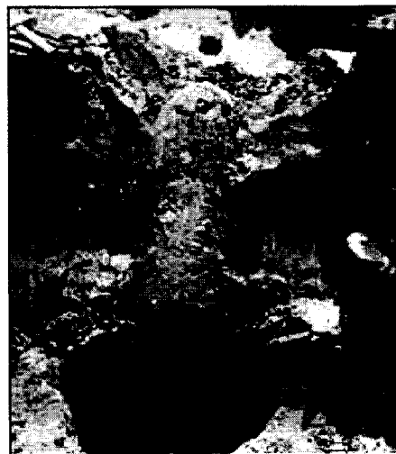
Abb. 1. Fliegerbombe, angetroffen bei Bauarbeiten in der Nähe einer Tankstelle

Daher werden Bauvorhaben immer wieder durch Kampfmittelfunde, ja sogar auch „Explosionen von Kampfmitteln“ gestoppt (Abb. 2).