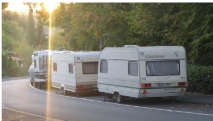
Typische Parkplatzsituation im bezeichneten Bereich