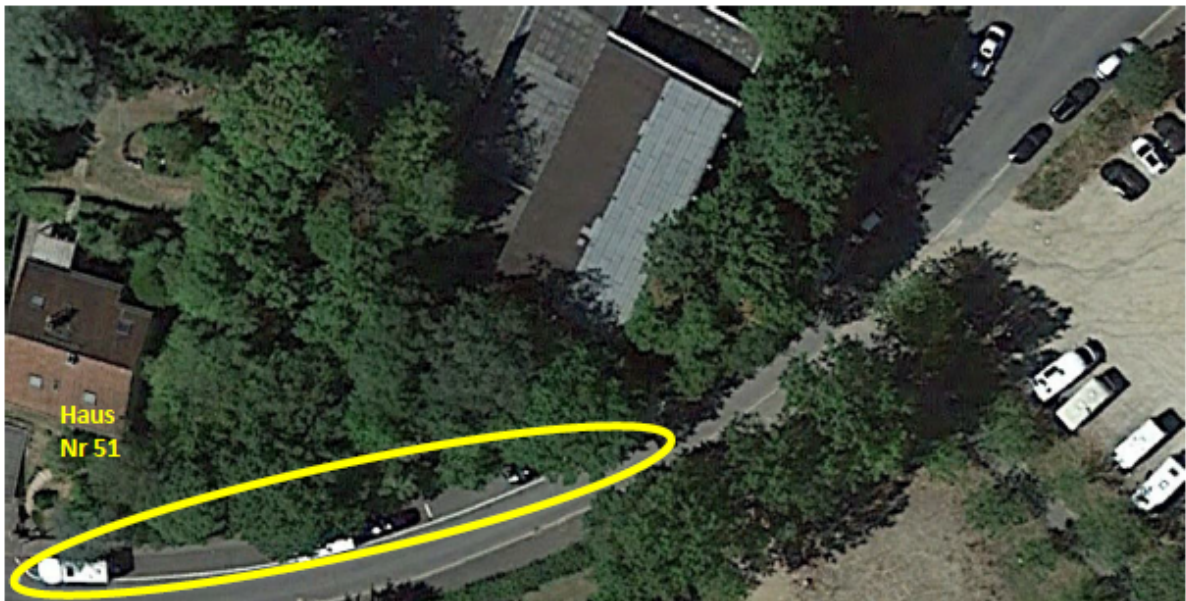
Ansicht in Google Maps des betreffenden Bereichs