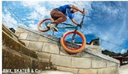
BMX, SKATEN & Co.