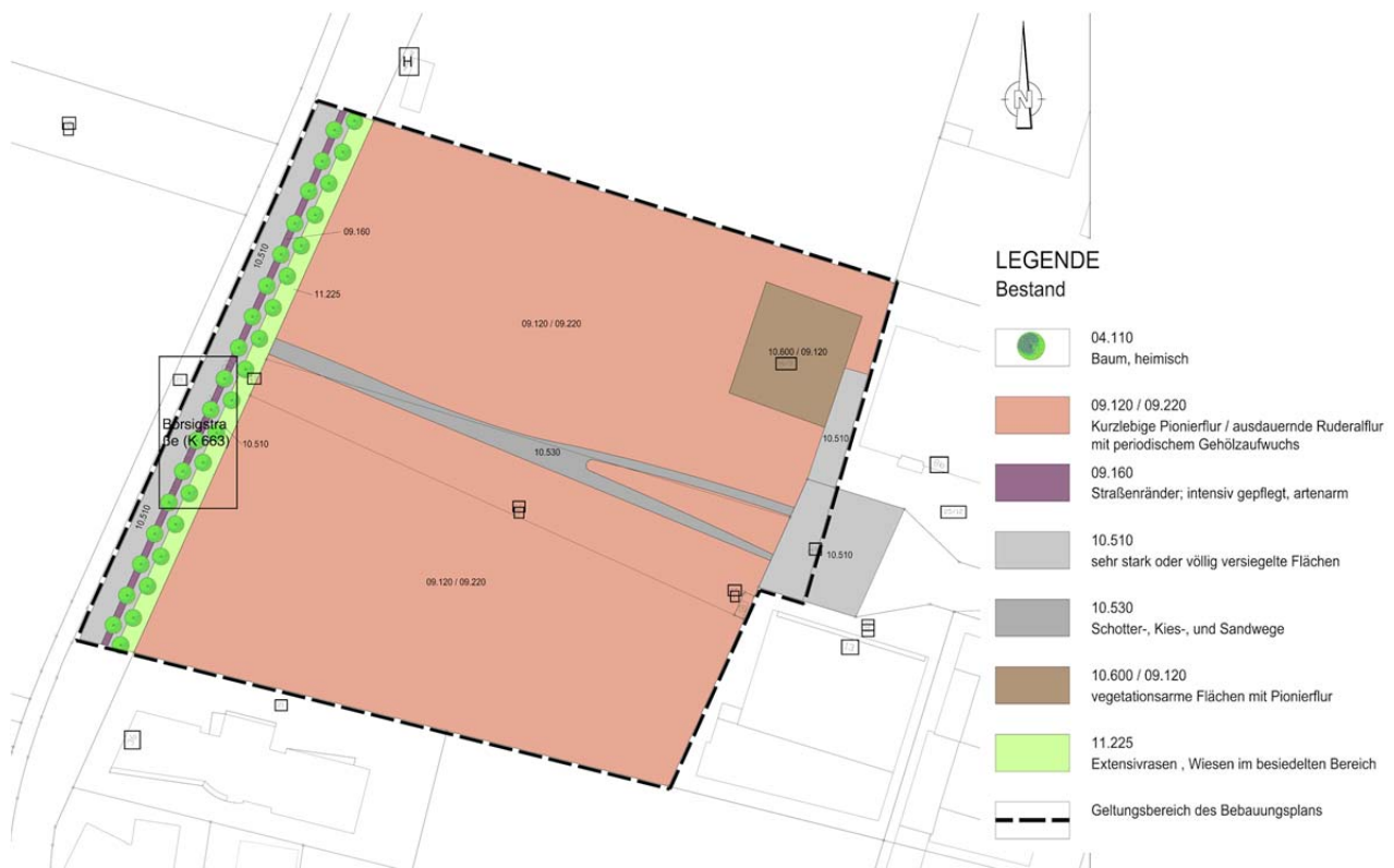
Abbildung: Darstellung der Umweltbelange - Bestandsplan (verkleinerte Darstellung) Naturprofil Planung und Beratung, Wiesbaden, August 2016

Das Gewerbegrundstück wird von einer Pionier- und Ruderalvegetation mit räumlich wechselnden Deckungsgraden bewachsen. Stellenweise breitet sich ein niedriger Gehölzaufwuchs aus. Die Fläche wird allerdings durch extensive aber regelmäßige Pflegeeingriffe offen gehalten.