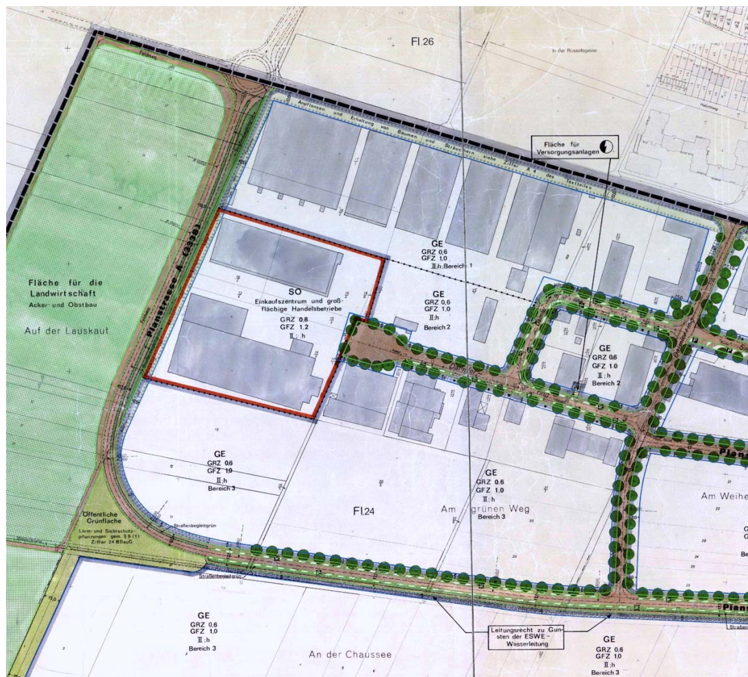
Abbildung: Ausschnitt aus dem Bebauungsplan „Am grünen Weg“ (Nordenstadt 1988/01)

Plangebiets auf Höhe des Bereichs 2 (nicht wesentlich störendes Gewerbe), der südliche Teil des Plangebiets auf Höhe des Bereichs 3 (allgemeines Gewerbe).