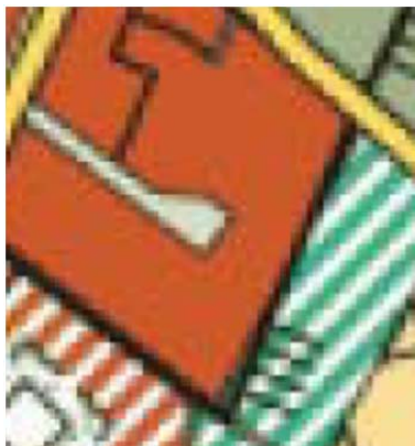
Auszug aus dem Landschaftsplan, unmaßstäblich

Der Landschaftsplan (Planung) der Landeshauptstadt Wiesbaden stellt das Planungsgebiet als „Siedlung mit Wohnbauflächen“ dar.