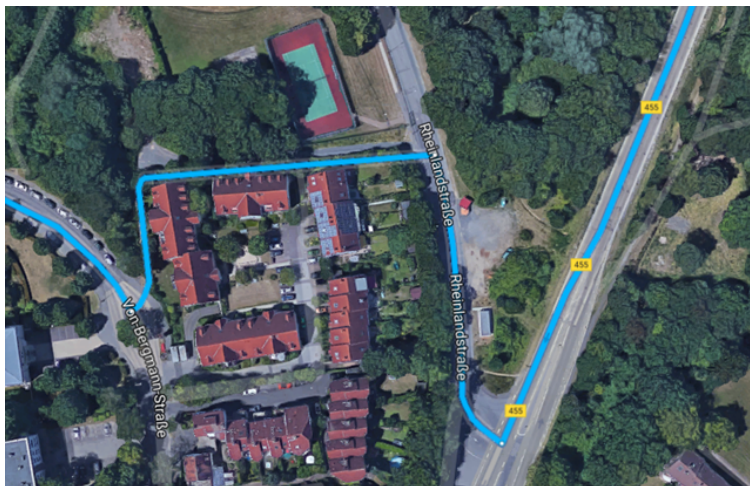
Abbildung 2: Querverbindung B455 zur Aukammallee

Die Querverbindung über die Rheinlandstraße zur Aukammallee bietet eine Route abseits der Hauptverkehrsstrecken des Automobilverkehrs entlang der Bierstädter Höhe und erhöht zudem die Attraktivität der Radbenutzung auch für weitere östliche Vororte indem die vorhandenen Routen vervollständigt werden, z.B. für Kloppenheim. Voraussetzung hierfür ist auch, dass die sichere Überquerung der B455 gewährleistet ist. Die Reisezeit zur Innenstadt wird verkürzt und die Sicherheit der Radwege verbessert.