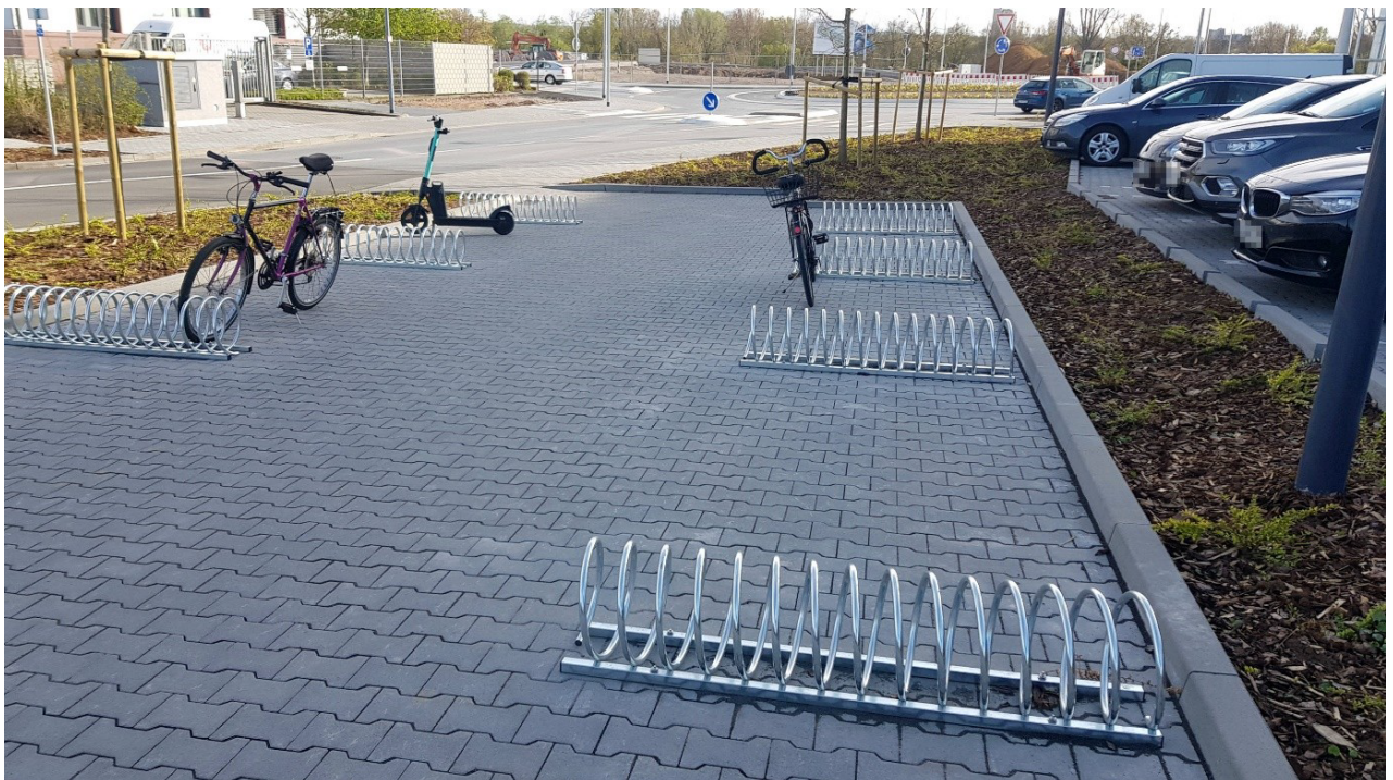
Abbildung 1: Fahrrad-Abstellanlage an der Einfahrt zum PKW-Parkplatz mit Metallspiralensystemen am Boden. Dieser Fahrradparkplatz kann leider nicht fahrend erreicht werden.

Dies betrifft vor allem die Abstellanlage an der Einfahrt zum PKW-Parkplatz, jedoch auch die im Bereich der Ladenzeilen. Dort sind, wie in Abbildung 1 zu sehen, jeweils Metallspiralensysteme am Boden installiert, an denen Fahrräder abgestellt werden sollen.