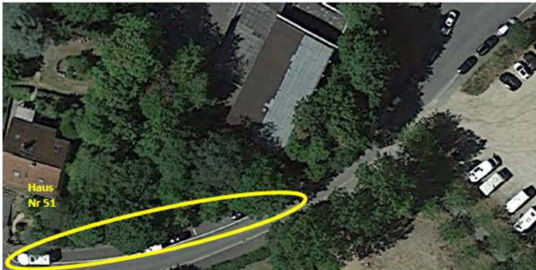
Ansicht in Google Maps des betreffenden Bereichs