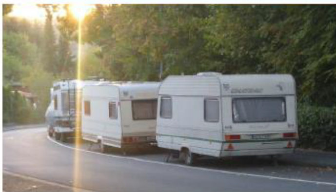
Typische Parkplatzsituation im bezeichneten Bereich